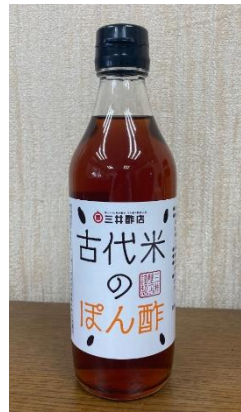
ルビー色の「古代米のぼん酢」