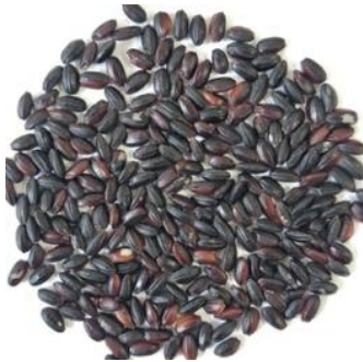
「峰のむらさき」玄米

「古代米のぼん酢」は、愛知県農業総合試験場山間農業研究所(豊田市)が育種開発した紫黒米「峰のむらさき」、南知多町の魚醤「しこの露」、碧南市の白醤油など愛知県産の原材料及び調味料を活用しています。紫黒米の色素（アントシアニン）を有効利用したルビー色のぼん酢を紹介します。