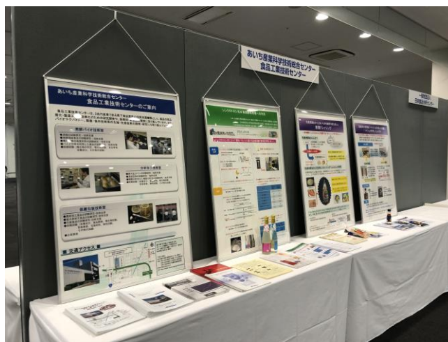
展示パネル、開発品など