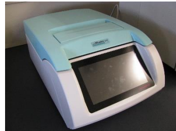
図2 ノバシーナ社製の水分活性測定装置

当センターではノバシーナ社製の水分活性測定装置「LabMASTER-aw NEO awSens-ENS」を平成 30 年度に導入しています (図2)。食安発 0729 第 4 号、及び食品衛生検査指針 2015 では、食品の水分活性を測定する際、①測定装置は電気抵抗式によるもの、②小数点以下 2 桁目に誤差を含まないこと、③ 25^{\circ}\text{C}\pm 2^{\circ}\text{C} で測定できること、という条件が記載されていますが、本装置は①~③の全ての条件を満たしています。当センターでは 1 測定 9,900 円にて水分活性の分析依頼を受け付けておりますので、お気軽にお問い合わせください。