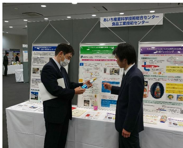
研究開発品の説明

当センターからは「食品工業技術センターの紹介」「シンクロトン光の利用」「発酵おからドレッシング」「深海魚の魚醤、ふりかけ」のテーマで出展し、多くの来場者がありました。