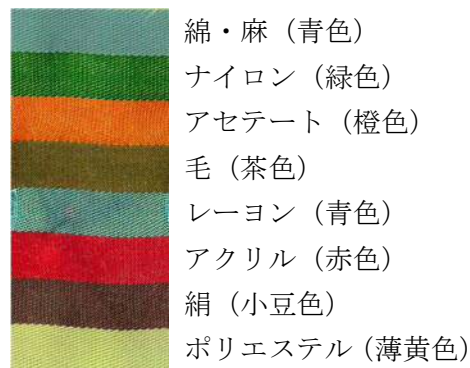
図2 鑑別染料(ボーケンステインII)による染色例 3)

ただし、鑑別染料は色物には不向きであり、加工により染着性が変化することがあるため注意が必要です。また、カチオン可染ポリエステルや酸性可染アクリルなど、染色性を変えた繊維もあるため、化学繊維は必ず他の試験と組み合わせて判別する必要があります。