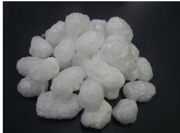
図2 デンプン主体の発泡緩衝剤

当センターでは2軸エクストルーダーを利用して、硝酸二アンモニウムセリウムを含むトウモロコシデンプン-ポリ乳酸混合物と粉末油脂を処理し、デンプン主体の発泡緩衝剤を作製した研究実績があります（ 図2 ） 6) 。