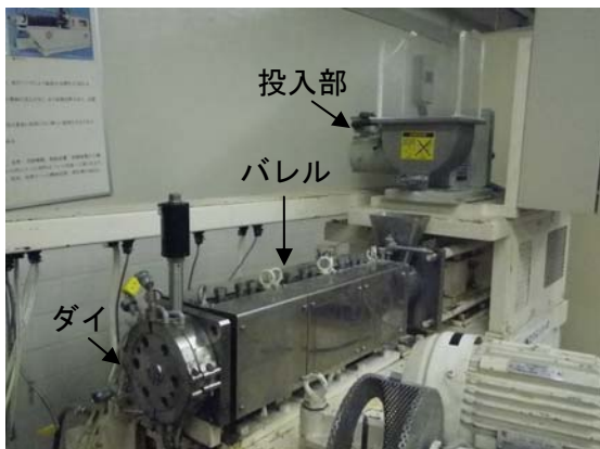
図1 2軸エクストルーダー (スクリーはバレルの中に存在)

材料は投入部から加えられ、高温のバレル中で、スクリーにより水と混合されながら圧力がかけられ、ダイから押し出されます。