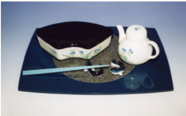
写真5 露草弁当箱揃

蓋は弁当の使用目的に合った機能が必要になるが、今回は家庭内で弁当を楽しむことを目的にしているため、上から乗せる形状とし、磁器製と木製の二種を作成した。磁器製の蓋は、自由な形状に成形ができ、清潔感があり、表面も硬く傷つきにくい、加飾技法も多彩である。木製の蓋は磁器製と比べると軽くて保温性が良いことや、表面が柔らかく滑りにくいいため、積み重ねが良好である。