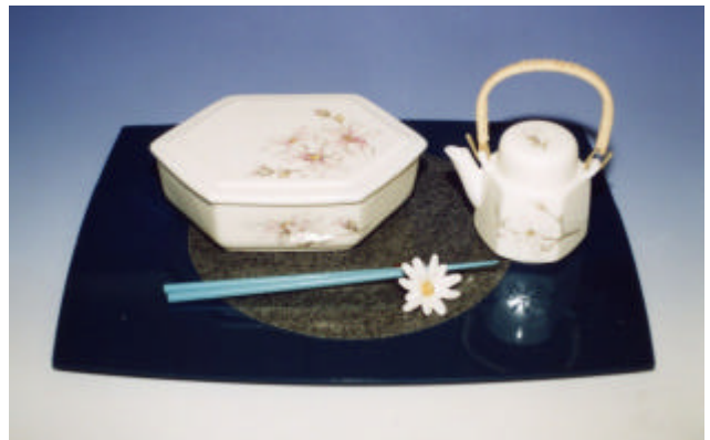
写真2 シデコブシ弁当箱揃

形状は優しさのあるまゆ形とし、菖蒲と兜を描いた。赤飯やちらし寿司、五目御飯を入れて五月の節句を楽しむ。また、子供が好むピラフやチャーハン、オムライスなど、洋風の弁当も楽しめる。鯉のぼり形の箸置と汽車土瓶形茶器を組み合わせた。