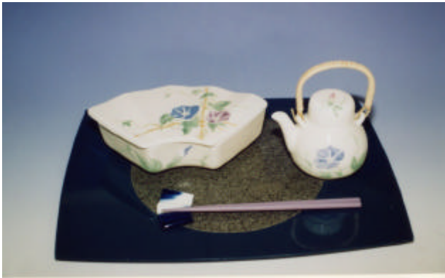
写真4 朝顔弁当箱揃

しらった。弁当のほか、冷麺やざるそば等にも用いることができ、この場合は茶器をそばつゆ入れとして使用する。箸置は朝顔の花をかたどった。