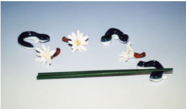
写真8 シデコブシ・うなぎ箸置