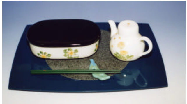
写真1 タンポポ弁当箱揃

レストにも使用できるようサイズを少し大きくした。蓋は黒い漆塗りの木製にして保温性や積み重ねを考慮した。