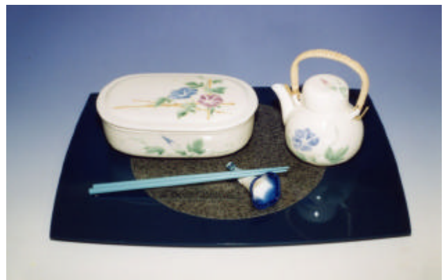
写真6 朝顔弁当箱揃

旅行途中の車で駅弁を買い、小さな土瓶から蓋を使って一口ずつ飲む。楽しい気持ちを食卓に持ち込んだもので、小さい土瓶と、蓋を小さなカップにしてお茶を飲むことで気分を楽しくする。形状は汽車土瓶のイメージを損なわないように亀甲形と、新しさを付け加えた丸形を作成した。取っ手はハンドルと土瓶臺を付けたものを作り、胴体が同形でも異なった感覚で使用できるようにした(茶器、ポット、汁注ぎ)。