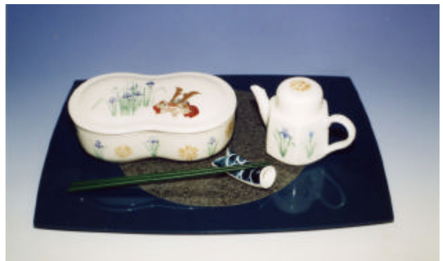
写真3 菖蒲弁当箱揃