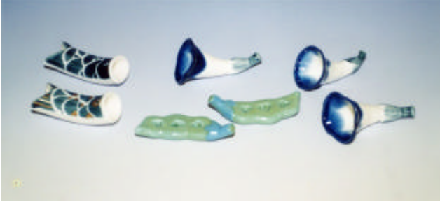
写真7 エンドウ・朝顔・鯉のぼり箸置

楽しむ時の箸置（スプーン）として作ってみた。料理の 中に入っているグリーンピースを題材とした。