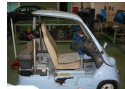
超小型電気自動車セミナー