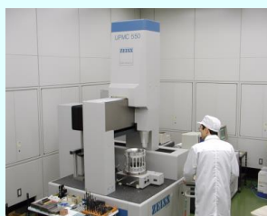
超精密三次元測定機

接触式プローブにより、 \mu\text{m} の精度で寸法、形状、幾何公差などを評価します。 手数料 1,400円～