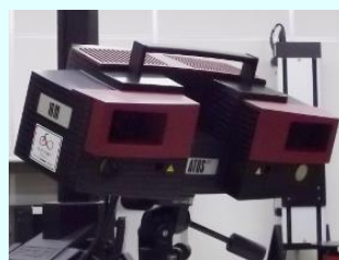
非接触三次元デジタイザー

接触式プローブにより、 \mu\text{m} の精度で寸法、形状、幾何公差などを評価します。 手数料 1,400円～