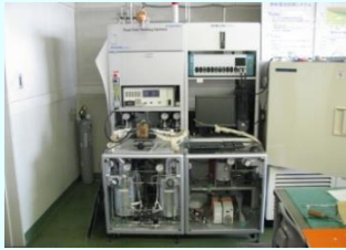
燃料電池評価装置

燃料電池の電流-電圧試験、交流インピーダンス試験などが可能です。 手数料 11,400円～