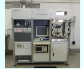
コーンカロリーメータ

段ボール箱などの包装容器的の圧縮強度、パレットの曲げ強度などを評価します。 手数料 6,900円/測定