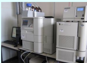
液体クロマトグラフ(LC/MS)

原料、製品、排水に含まれる有機物の高精度な定性や定量分析を行います。 手数料 23,900円～