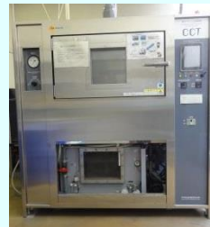
複合サイクル試験機

金属材料など各種部材の静ねじり、疲労ねじり強度が測定できます。 手数料 2,900円～