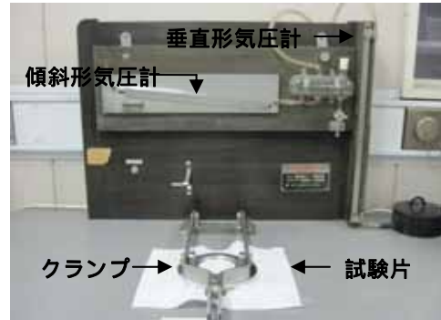
図2 フラジール形通気性試験機

測定方法は、試験片を取り付けた後、加減抵抗器によって「傾斜形気圧計」が125 Pa（水柱1.27 cmH 2 O）の圧力（風速15 m/sに相当）を示すように空気の吸い込みファンを調整し、試験片の表裏両面の圧力差を一定に保つときの「垂直形気圧計」の示す圧力と、使用した空気孔の種類とから、試験片を通過する「空気量（cm 3 /cm 2 ・s）」を求めます。