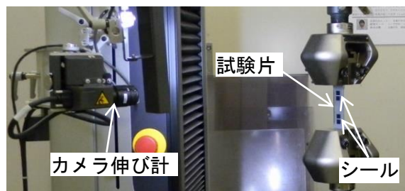
図1 カメラ伸び計を用いた引張試験