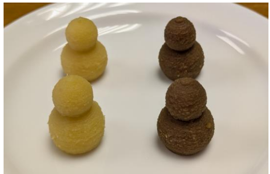
図3 完成したひょうたん徳利様の造形物 （左：中身のみを使用 右：中身及び皮を使用）