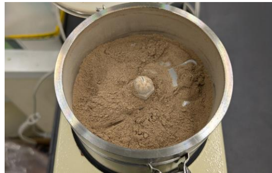
図2 粉末化した焼き芋の皮

3Dフードプリンターは、野菜のくずや廃棄される食材も活用できます。例えば、今回のようなサツマイモの焼き芋では、皮は硬い、苦い等の理由から食べない方も多く、フードロスとなってしまうことがあります。もちろん、この焼き芋の皮も3Dフードプリンターの材料として活用できますが、中身のようにそのままでは均一なペースト状にはなりません。そこで、皮を電子レンジで乾燥し、粉碎機で粉末化しました（図2）。この粉末を中身のペーストに均一に混ぜることで、中身と同様に3Dプリントが可能です（図3）。