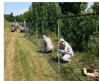
図4 ネット設置風景