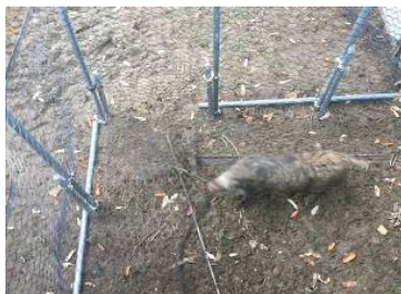
図3 ネットに噛みつくイノシシ