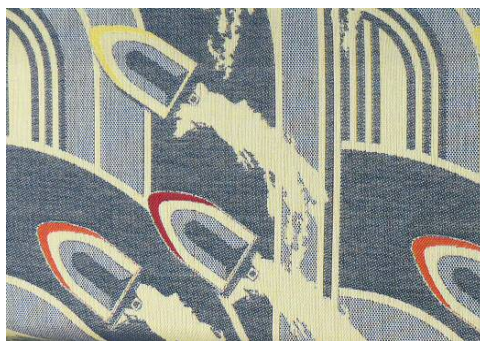
図6 ボートレースをモチーフとしたジャカード織物 ※10

蒲郡競艇場のボートレースと三河縞 ※9 をモチーフとしたインテリア織物を試作しました（図6）。