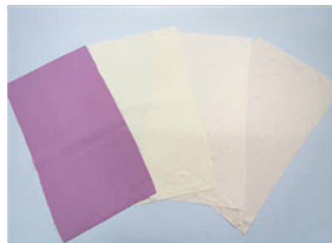
図5 花びらを用いた天然染色絹織物

なお、本試作品に用いた花びらは、県知多農林水産事務所農業改良普及課の協力を得て入手したものです。