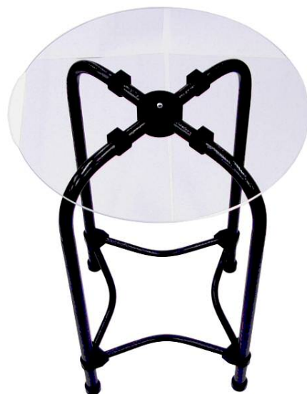
図1 90°曲げたCFRTPパイプを使用したテーブル

6 」のうちの研究テーマ「自動車軽量化のための熱可塑性炭素繊維強化樹脂の加工技術開発」の研究成果の一部を発展させて試作したものです。