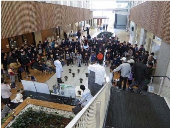
昨年度のサイエンスフェスタの様子