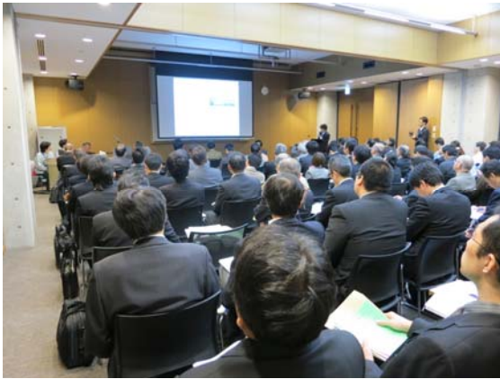
昨年の合同発表会の様子

中部経済産業記者会、名古屋市政記者クラブ、 名古屋経済記者クラブ、瀬戸市記者会、 豊田市政記者クラブ、豊田市政記者東クラブ、長久手市同時