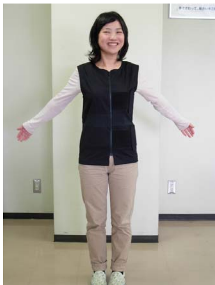
開発品(ベストに仕立てたもの)