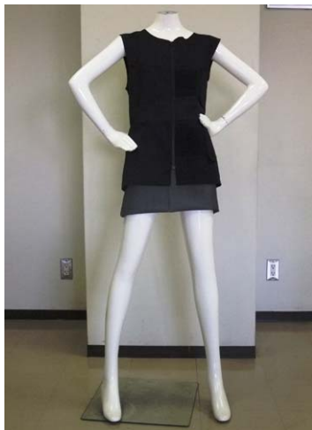
開発した胸の動きを計測できる衣服

平成 25 年 3 月 13 日 (水) あいち産業科学技術総合センター 尾張繊維技術センター素材開発室 担当 島上、堀場、池口 電話 0586-45-7871 (代表) 愛知県産業労働部産業科学技術課 科学技術グループ 担当 中川、榊原 (悟)、加藤 (英) 内線 3383、3382 電話 052-954-6351 (ダイヤルイン) 公益財団法人科学技術交流財団 知の拠点重点研究プロジェクト統括部 担当 山本 (良)、村山、富田 電話 0561-76-8380 (ダイヤルイン)