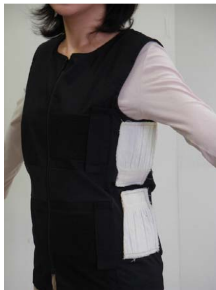
伸縮を検知できる布(脇の白い部分)