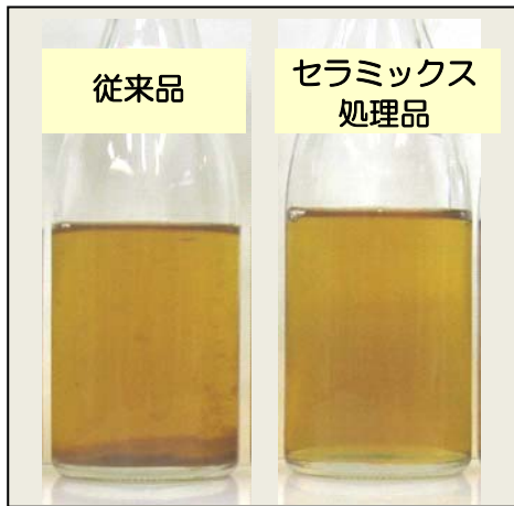
保存試験結果 開発品(右)は沈殿物が発生しない

平成25年3月13日(水) あいち産業科学技術総合センター 食品工業技術センター 担当 近藤(徹)、児島、中莖 電話 052-521-9316 常滑窯業技術センター 担当 福原 電話 0569-35-5151 愛知県産業労働部産業科学技術課 管理・調整グループ 担当 西村、山口 内線 3381、3389 (ダイヤルイン)052-954-6347