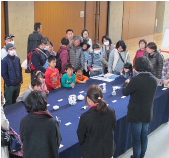
昨年度のサイエンスフェスタの様子