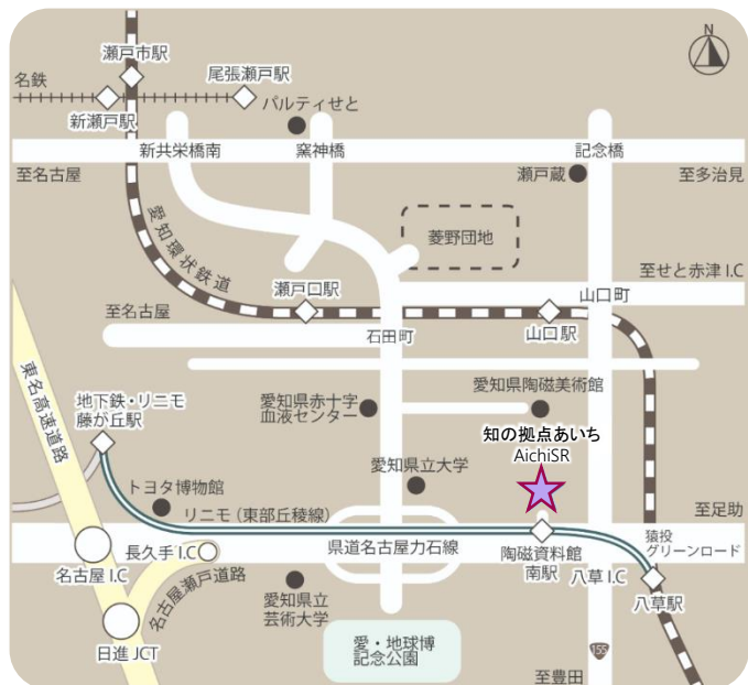
あいちシンクロトロン光センター (AichiSR)