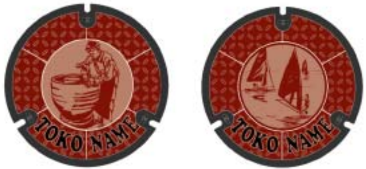
写真4 マンホール蓋スケッチ