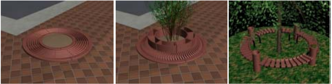
写真2 ツリーサークルのスケッチ