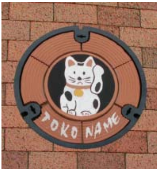
写真5 マンホール蓋「招き猫」