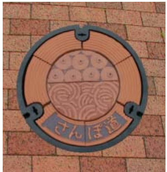
写真6 マンホール蓋「さんぽ道」