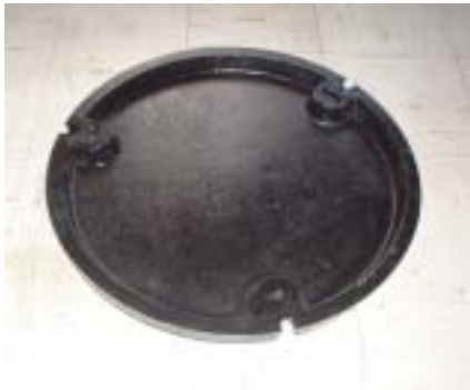
写真3 埋め込みタイプ 鋳鉄製蓋