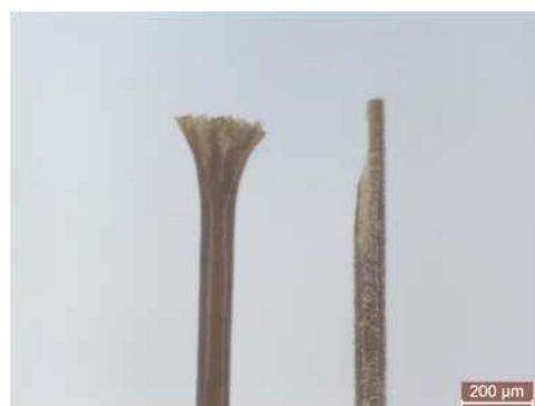
図5 圧挫（左）、引きちぎり（右）の毛先

断されたものは圧挫、毛軸方向に引っ張られて切断されたものは引きちぎりの形態を示します(図5)。