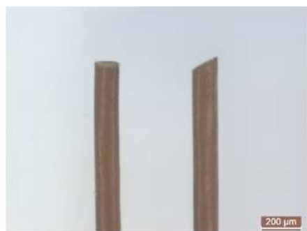
図4 横断状（左）、斜断状（右）の毛先

衛生上問題になるネズミの毛の特徴は、小皮紋理が山形状で、毛髄質は扁平な空胞が重なった形態を呈しています。