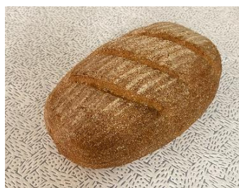
写真1: サワー種法により製造したライ麦パン

ライ麦パン(写真1)は、発酵種を利用する方法の一種であるサワー種法により製造され、乳酸菌が組織形成だけでなく、豊かな風味にも関与しています。ここでは、ライ麦パン製造におけるサワー種中の乳酸菌と香気成分について紹介します。