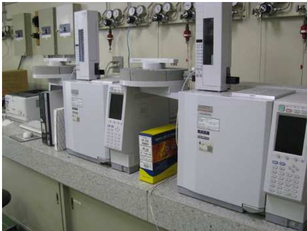
図2 ガスクロマトグラフ装置

の高極性の固定相に吸着させます。これに熱をかけると気化しやすい低炭素数の脂肪酸エステルから、同一炭素数の場合は不飽和結合が少ない脂肪酸の方が極性が低いいため先に気化し、気