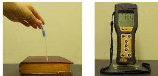
図2 （左）：白かびの発生した本のATPふき取り検査、（右）：ATP測定器

事例では製品の汚れ部分を切り取って分析に持ち込んでもらいましたが、汚れ部分を切り取らずにかびか否かを簡易判別する方法のひとつとしてATPふき取り検査が考えられます。この検査では試薬と一体化した綿棒で汚れ部分を拭き取った後、試薬の入った綿棒上部を折って反応させ測定器（ 図2右 ）にセットする、という簡単な操作で、かびなどの生きた細胞に由来する遊離ATP量を数分で数値化することができます。実際に 図1 の樹脂製繊維の黒い汚れを用いて検査を行いました。陽性対照の試料として白かびの発生した本（ 図2左 ）を用いました。その結果（ 表1 ）、清浄な部分はほぼ0であったのに対し、樹脂製繊維の黒い汚れは106 RLU、白かびの発生した本は594 RLUと高い値を示し、かび生細胞の存在が示唆されました。このようにATPふき取り検査は樹脂製繊維に発生した汚れがかびか否かを簡易判別するのに有用であると考えられます。