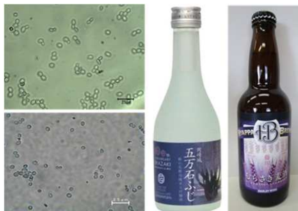
図2 五万石ふじ酵母を利用した複発酵酒 (左: 清酒、右: クラフトビール)

愛知県の地域産業資源である岡崎公園の五万石ふじの花から酵母 Saccharomyces cerevisiae の分離に成功し、28SrDNA のD1/D2 領域の遺伝子配列が異なる 5 株の酵母を取得しました。ここからアルコール発酵能の優れた 2 株を選抜し、ブドウ糖の資化能が高い酵母 (GF1) を清酒醸造に、麦芽糖の資化能が高い酵母 (GF3) をビール醸造に利用するため、岡崎市の酒類製造企業に対し技術移転を行いました。その結果、地域ブランド製品としてふさわしい清酒及びクラフトビールの開発に結び付けることができ、地元のイベント等で販売されました 1)2) (図2)。