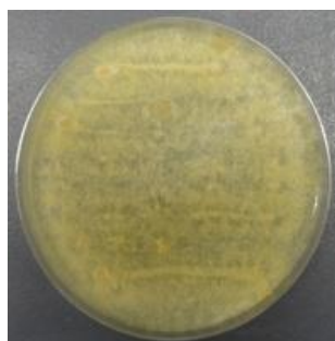
図2 変敗製品から分離された耐熱性かびの例（ Byssochlamys 属）

は死滅しますが、子嚢胞子は生残します。そして、加熱処理等が引き金となり、胞子の休眠が打破されて発芽し、変敗を引き起こします。