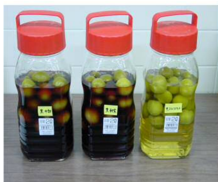
図1 梅酒仕込の外観