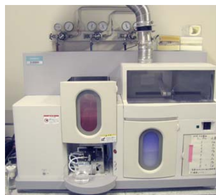
図2 原子吸光光度計

測定方法の一例を紹介します。均一にした食品試料7gをろつばに採取し、550℃で灰化します。灰化した試料を希塩酸に溶解し、ナトリウムとして数ppmの濃度まで希釈します。この試験液を原子吸光光度計(図2)に導入し、アセチレンによる高温の炎で原子化させ、原子に固有の吸収スペクトルから、ナトリウムの濃度を求めます。その後希釈倍数等から食品100gあたりのナトリウム量を計算します。食塩に換算する場合は更に2.54倍します。当センターでは栄養成分分析の1項目としてナトリウムの依頼試験を実施しています。