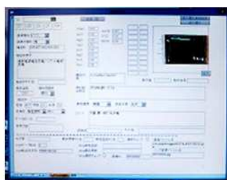
釉薬データベースの閲覧画面

記念講演：釉薬データベースの利用方法 ～名古屋工業技術試験所・ 産業技術総合研究所中部センターの歴史とともに～