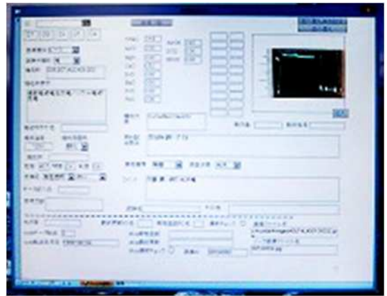
図2 釉薬データベースの閲覧画面