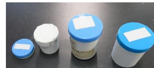
各種熱接触材料(サーマルグリース)

実使用環境に近い方法により候補材料を評価することで、根拠に基づいた実用的な材料選定が可能になった。この結果、製品の信頼性を向上させつつコストダウンできる見通しを得た。