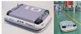
磁気誘導方式無人搬送車 (AGV) 村田機械株式会社

インダストリアルデザインを主体としたデザイン会社。 「全体から部分を見つめ、そこからまた全体を見直す」という考え方を土台にして、「企画⇒デザイン⇒設計⇒生産⇒販売」というモノづくり全てのステージでアイデア展開を担う。 幅広い業種の商品デザインを中心に素材開発や地域産業の活性化など異色の分野にも多くの実績を誇る。