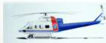
防災ヘリコプター 愛知県

インダストリアルデザインを主体としたデザイン会社。 「全体から部分を見つめ、そこからまた全体を見直す」という考え方を土台にして、「企画⇒デザイン⇒設計⇒生産⇒販売」というモノづくり全てのステージでアイデア展開を担う。 幅広い業種の商品デザインを中心に素材開発や地域産業の活性化など異色の分野にも多くの実績を誇る。