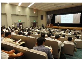
工業技術研究大会