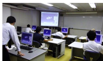
3次元CAD操作方法の研修