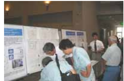
ポスターセッション風景

なお当日は、約 1 7 0 名の方々に参加をいただき、大盛況のうちに大会を終了いたしました。