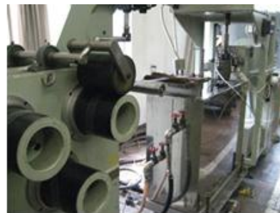
図1 モノフィラメント製造装置

続いて、熱風槽前後のローラー速度を制御し、繊維を熱処理・セットします。最後にワインダーでボビンに巻取ります。