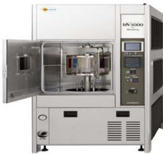
図1 導入された超促進耐候性試験機 (スクリーン製MV3000)

今回、当センターでは、この耐候性を評価する装置として紫外部に強大なエネルギーを持つメタリングランプを搭載した超促進性耐候試験機メタリングウェザーメーター（ 図1 ）を導入しました。上述従来型試験機とは異なり、まだ規格化はされていませんが、建築・自動車・塗料・樹脂などのメーカーで採用されています。