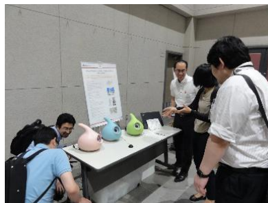
ポスター発表の様子