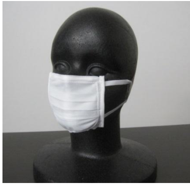
図1 抗菌性ナノファイバーマスク