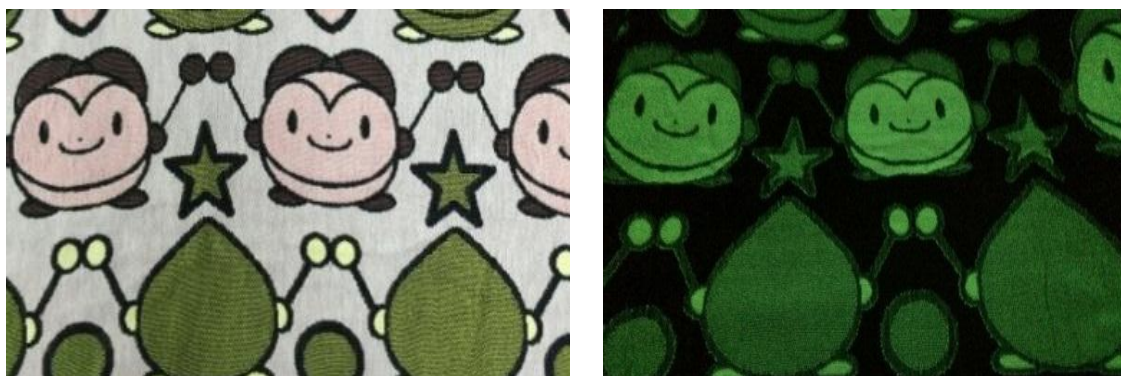
図4 通常時（左）及び暗黒時（右）

柄部分に蓄光糸を浮かせた組織にすることにより、柄部分だけが発光するように設計しました。衣料、インテリア分野等、様々な用途展開が期待されます。