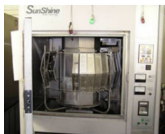
劣化評価のための 促進耐候性試験機