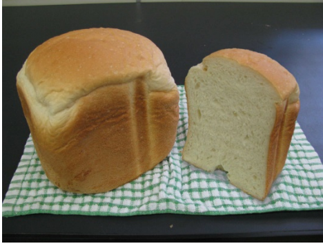
カキツバタ酵母を使った食パン

平成25年8月20日(火) あいち産業科学技術総合センター 食品工業技術センター 分析加工技術室 担当 間瀬、瀬見井 電話 052-521-9316(代) 愛知県産業労働部産業科学技術課 管理・調整グループ 担当 加藤(久)、山口 内線 3389、3388 ダイヤルイン 052-954-6347