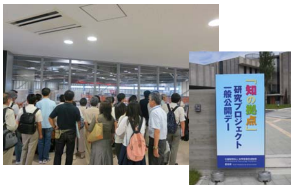
研究プロジェクト一般公開デー2012の開催風景 平成24年9月29日(土)