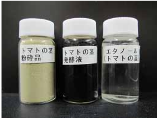
愛知県内で発生したトマトの茎の 廃材から作ったバイオエタノール