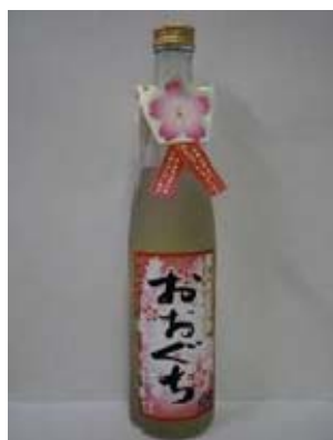
製品写真 （勲碧酒造株式会社製造）

「五条川の桜並木」から分離した酵母について、大口町商工会は酵母「五条川桜」で商標登録申請を行いました（商標出願2009-12832）。なお、酵母の所有権は愛知県産業技術研究所食品工業技術センターに帰属します。