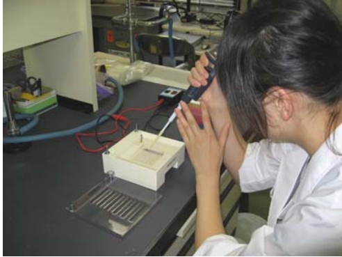
動物毛 DNA 検査の様子（電気泳動）