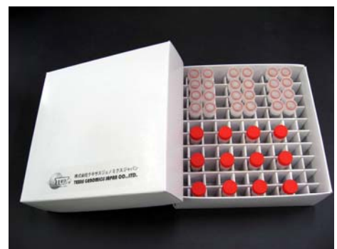
製品化されたプライマーキット

今回の実習では、県と実施契約を締結した企業により製品化されたプライマーキットを使用し、試料動物毛からのDNA抽出、種特異的DNAの増幅（PCR）、電気泳動、検出など、一連の操作を体験していただきます。